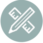
Terzi İş Sistem ve Panel Tasarımları