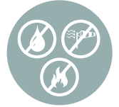
Özel İzolasyon Seçenekleri