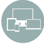
Uzaktan İzleme Sistemi