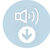
Süper Sessiz Kabinler