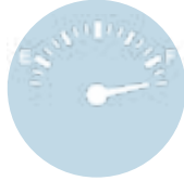
Özel Üretim Yakıt Tankları