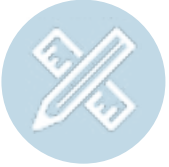
Terzi İş Sistem ve Panel Tasarımları