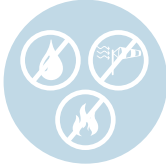
Özel İzolasyon Seçenekleri