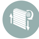
Sistemas Automáticos de Obturador