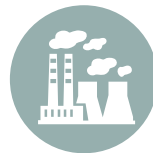
Plantas de Energía