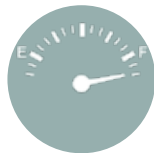
Tanques de Combustible Producidos A Medidas