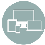
Sistema de Monitoreo Remoto